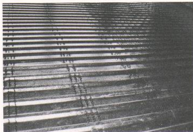
Bild 2. Trapezbleche und Verbundschrauben von oben gesehen