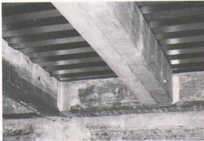
Bild 3. Holzbalken und Trapezbleche von unten gesehen