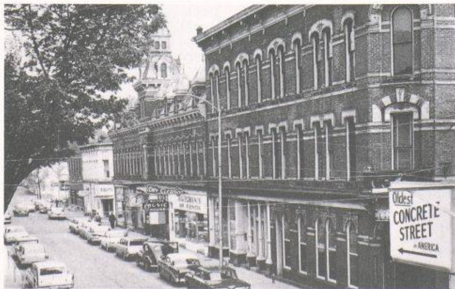
Die älteste Betonstrasse der Vereinigten Staaten (hier eine Aufnahme aus den sechziger Jahren) wurde vor 100 Jahren in Bellefontaine, Ohio, gebaut

Die Überbleibsel der historischen Strassen werden nun in eine Fussgängerzone integriert. Ein kürzlich enthülltes Denkmal erinnert an George Wells Bartholomew, den weitsichtigen Pionier des Betonstrassenbaus in den Vereinigten Staaten.