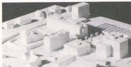
2. Rang: Rossi + Spillmann, Zug

Die in Aussicht gestellten Mittel von 12 Millionen Franken, verteilt über die Jahre