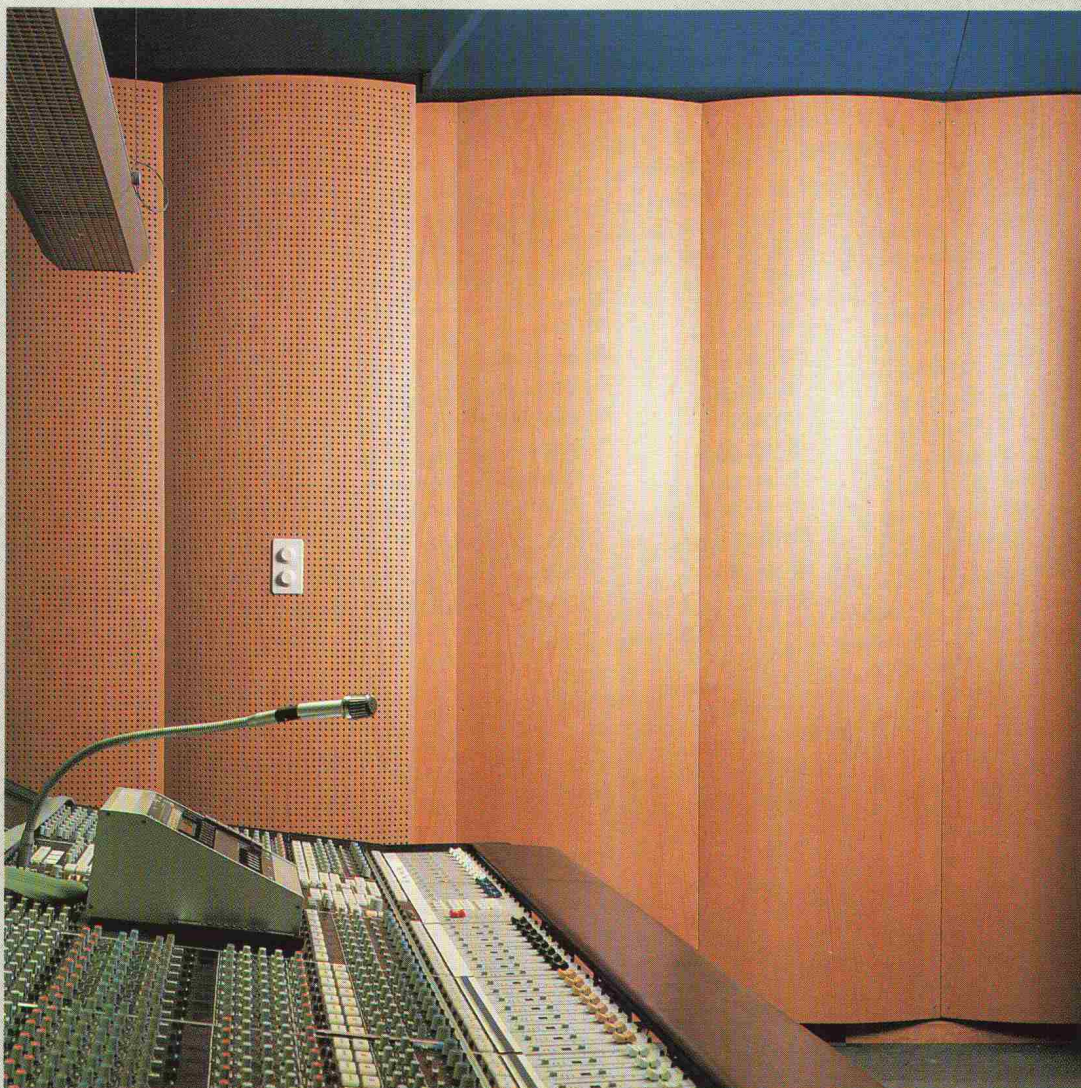
Verkleidungen für spezielle Akustik.