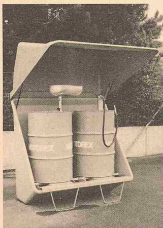
Das Fassgehäuse «Diogenes»

«Diogenes» kann drinnen oder im Freien aufgestellt werden und zeichnet sich auch durch Bedienungsfreundlichkeit aus. Mittels Rollbodens können die Fässer mühelos zum Beispiel auf einen Stapler gezogen werden. Das erhöht auch die Sicherheit. Bei der Konstruktion wurde auf bewährte Techniken und Materialien zurückgegriffen: Die tragenden Teile sind aus feuerverzinktem Stahl, Wanne und Gehäusedeckel aus glasfaserverstärktem Kunststoff. In einer späteren Phase ist für besondere Bedürfnisse eine Wanne aus Stahl vorgesehen.