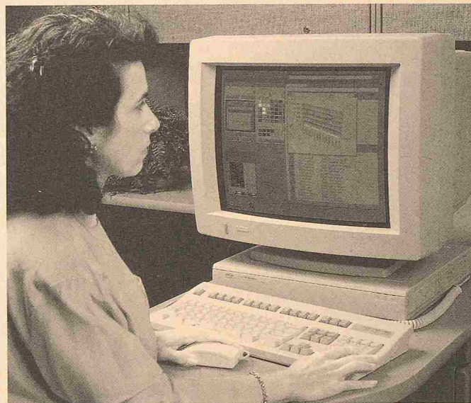
Hervorragende Grafikeigenschaften: Neuer PC von DEC