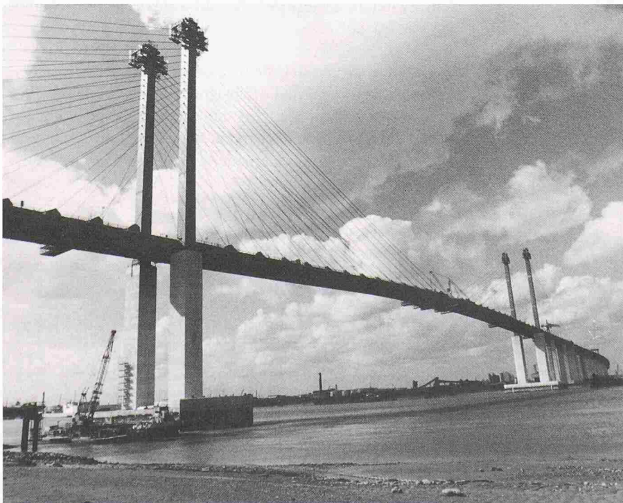
Die neue Themsebrücke ist die längste Schrägseilbrücke Europas. Ab Herbst dieses Jahres soll sie den Verkehr an der Peripherie Londons südwärts über die Themse führen.

Für häufige Benutzer der Dartford-Brücke wird ein elektronisches Zahlungssystem zur Verfügung stehen. Wenn sie sich der Zahlungsstelle nähern, wird ein Infrarotempfänger das Fahrzeug identifizieren und den Betrag direkt dem Konto des Halters belasten.