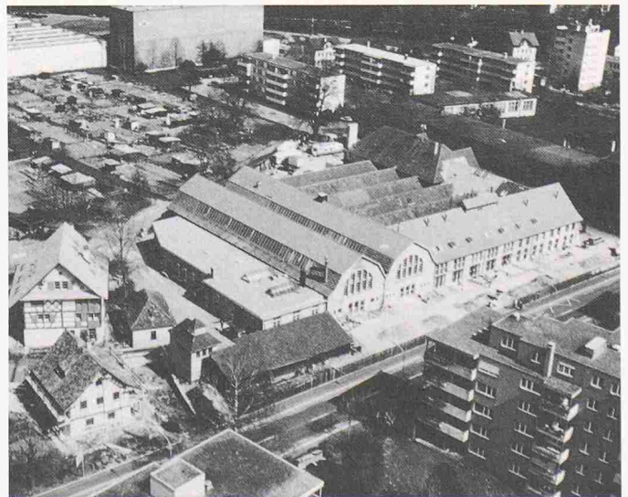
Gesamtansicht des Eisenwerks Frauenfeld. Die beispielhafte Umnutzung einer stillgelegten Fabrikanlage