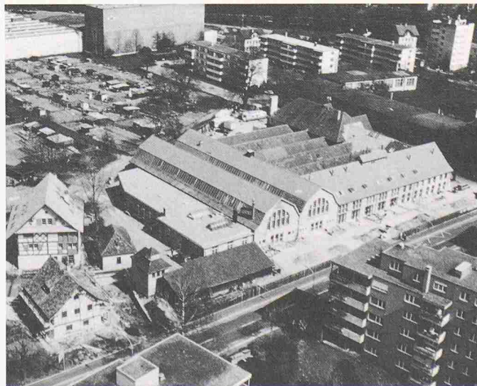
Gesamtansicht des Eisenwerks Frauenfeld. Die beispielhafte Umnutzung einer stillgelegten Fabrikanlage