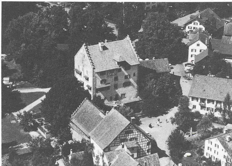
In der Mitte des Bildes Schloss Greifensee, ein markanter Treppengiebelbau

see einen Gebrauchsleihvertrag ausgearbeitet. Nach einer umfangreichen Innenrestauration, bei der die Wand- und Deckenmalereien überarbeitet und die veralteten haustechnischen Anlagen erneuert werden, sollen im über 700jährigen Schloss kulturelle Veranstaltungen der verschiedensten Richtungen stattfinden können.