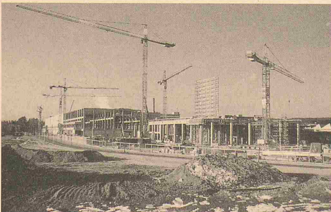
Wolff-Turmdrehkrane im Einsatz beim Bau der neuen Papierfabrikationshalle der Papierfabrik Biberist

Robert Aebi AG 8105 Regensdorf Tel. 01/842 51 11