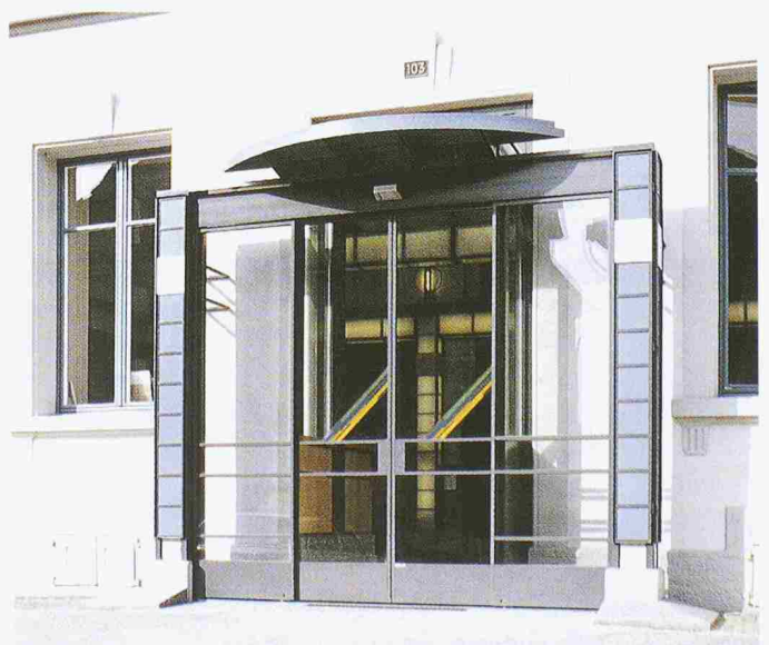
Bild 3. Neu gestaltete Eingangspartie zum alten Bahnhofgebäude