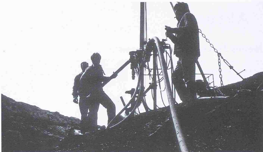
Den Alpen ins Fundament geschaut: Auf dem Rawilpass zwischen den Kantonen Bern und Wallis wird für die Wissenschaft eine Bohrung abgeteuft

Was vor 100 Millionen Jahre im Vorfeld der Alpenfaltung begonnen hat, ist noch nicht zu Ende: unsere Berge wach-