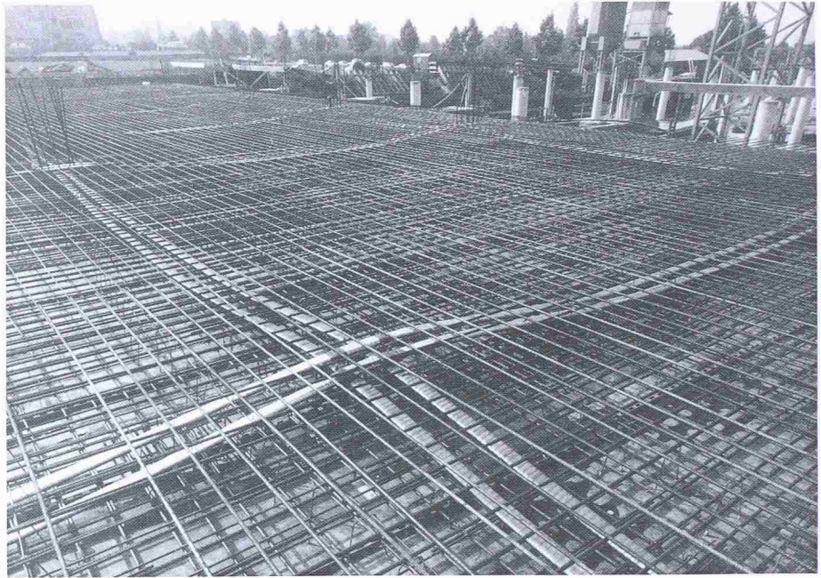
Bild 2. Stützstreifenvorspannung beim Gebäude «Apollo 2000» in Renens

sind vollständig verglast, aber durch vier Aussenbetonstützen auf jeder Seite unterteilt. Auf vier Stützen gelegen, ist das Gebäude in neun Felder (3 in jeder Richtung) von 7,5 auf 9,25 m Spannweite aufgeteilt und durch Betonschalen in den beiden Hauptrichtungen stabilisiert. Der zentrale Treppenhaus schacht ist durchbrochen und spiralförmig; der Aufzug befindet sich in einem seitlichen Feld.