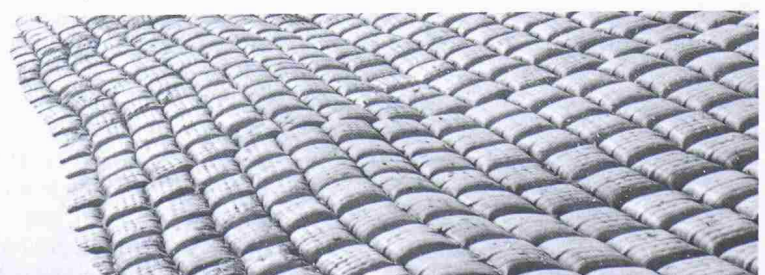
Bild 3a. Mit Pumpbeton verfüllte Gewebeschalung für Plattenmatten zur Sohl- und Böschungbefestigung für Rückhalte- und Absatzbecken sowie Flüsse und Kanäle (Mohr)