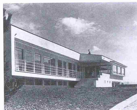
Haus Hodel, Meggen