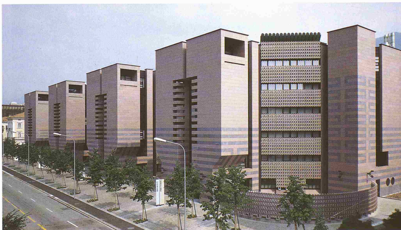
Die Hauptfront der Banca del Gottardo in Lugano, ein Botta-Bau, der im November 1988 eingeweiht wurde