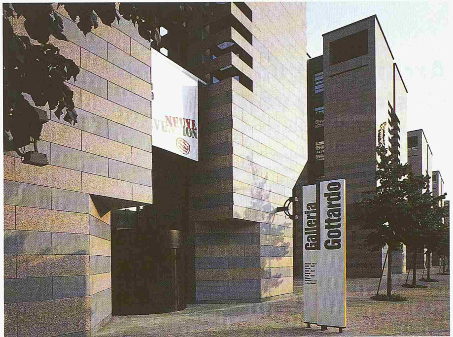
Der Eingang zur «Galleria Gottardo», die im Erdgeschoss des Bankhauses in Lugano zu finden ist

Adresse des Verfassers: Dr. C. von Castellberg, Gotthard Bank, Färberstr. 6, 8008 Zürich.