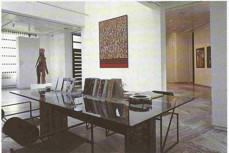
Ein Blick in die Räume der «Galleria Gottardo»