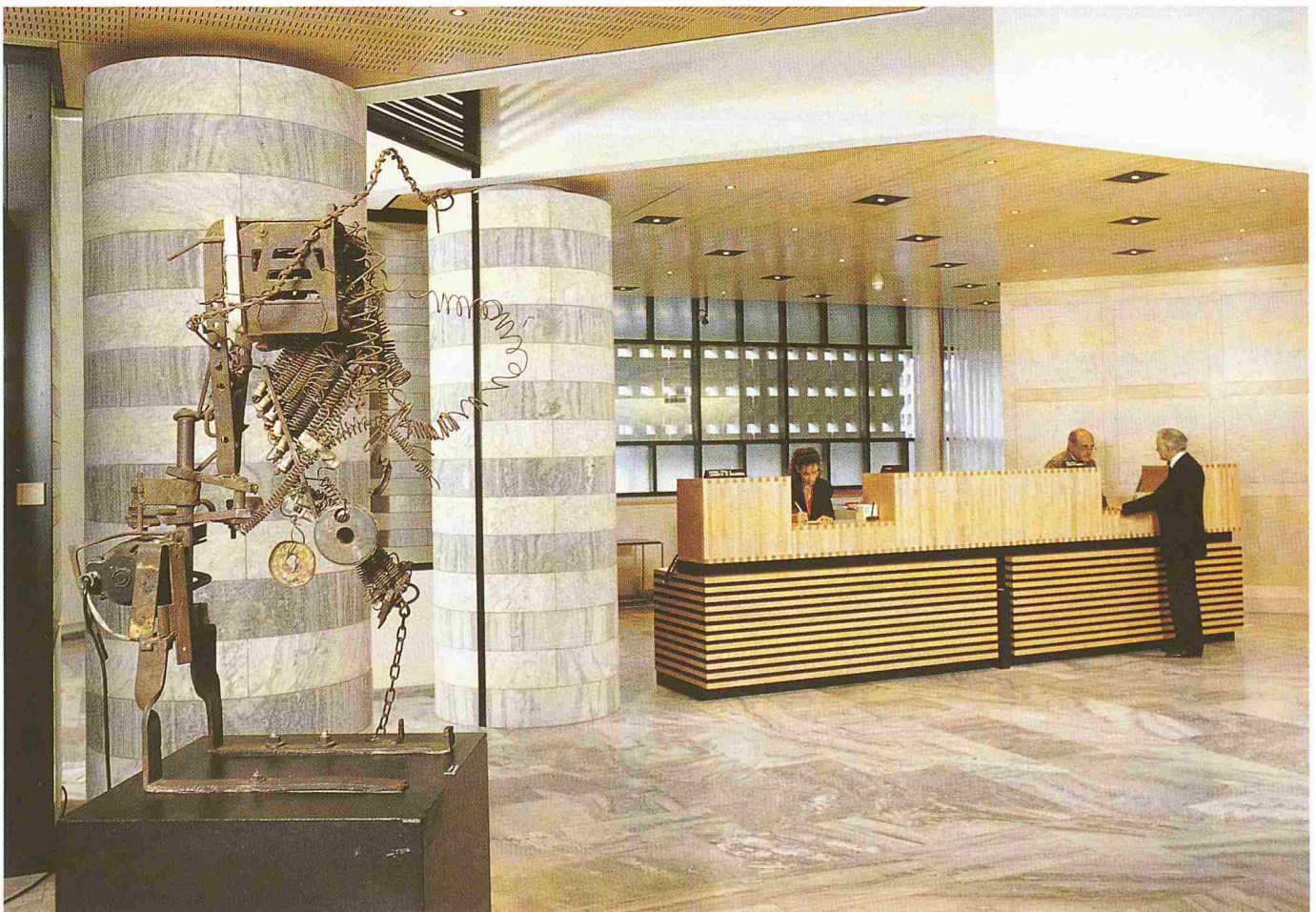
Tinguelys Eisenplastik «Totem IX» steht beim Eingang der Schalterhalle des neuen Hauptsitzes der Gotthard Bank in Lugano

Die Zeiten ändern sich und wir uns mit ihnen. Die neue junge Generation sieht die Thematik deutlich toleranter. Das Sponsoring ist allüberall, d.h. in allen Sparten, eine finanzielle Not-