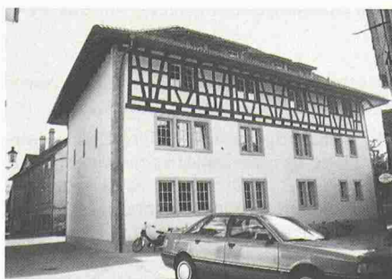
«Baroneschüür» in Winterthur

Eine Anerkennungsurkunde erhielt die Alfredo Piatti AG, Dietlikon, für ihre neue