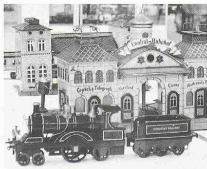
Eine Rarität aus der Sammlung A. Bommers am Technorama in Winterthur: Lokomotive von Bing, Nürnberg, Spur II, um 1902