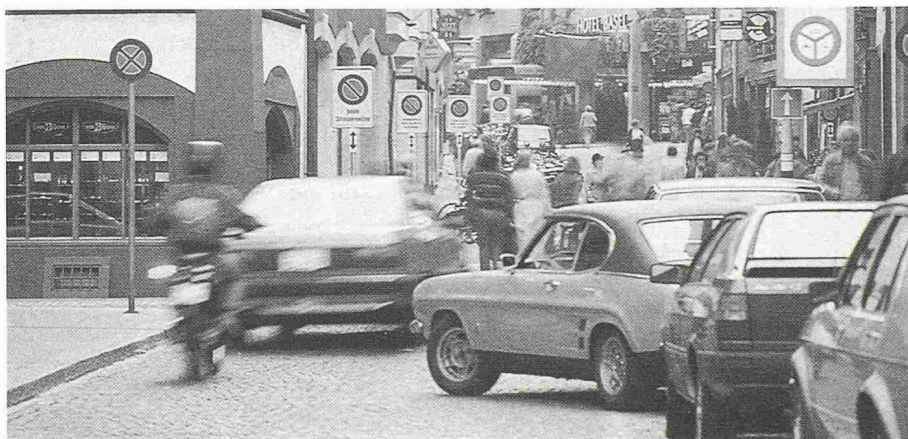
Stadtreparatur in Basel: Vormittags ist die Schneidergasse Verkehrsraum und dient den zahlreichen Geschäften zur Anlieferung

Aber auch diejenigen, für die alle anderen Werte geopfert wurden, sind nicht recht glücklich geworden. Menschen reagieren nicht nach rechnerischen Regeln. Bei eintöniger Gestaltung werden sie schneller müde. Die Griffigkeit