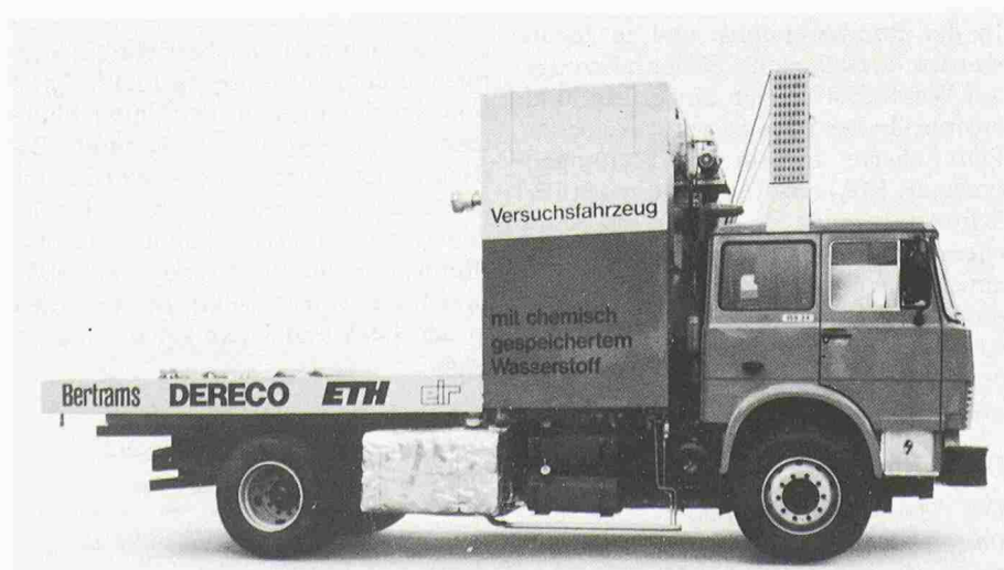
Bild 1. Wasserstoff-Versuchsfahrzeug der 2. Generation