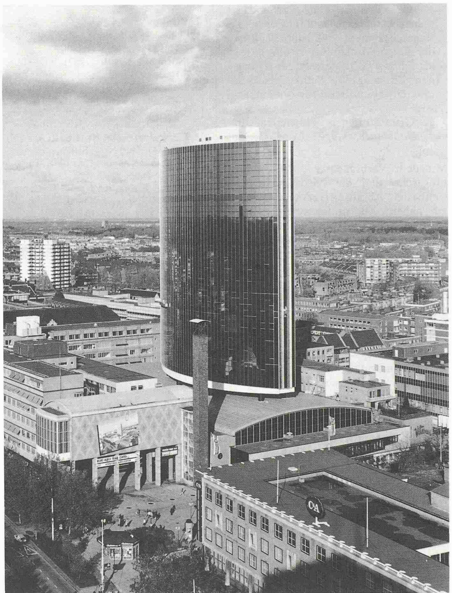
Bild 1. Überbauung des 40 Jahre alten Messegebäudes in Rotterdam mit einem 21stöckigen Verwaltungshochhaus (World Trade Centre) als aufgeständerte Stahlbetonkonstruktion