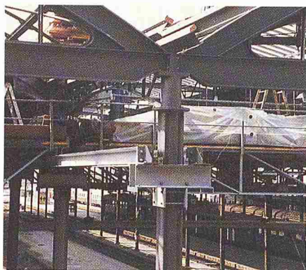
Bild 4. Nördliche Hallenverlängerung mit Schutz- und Arbeitsbühne