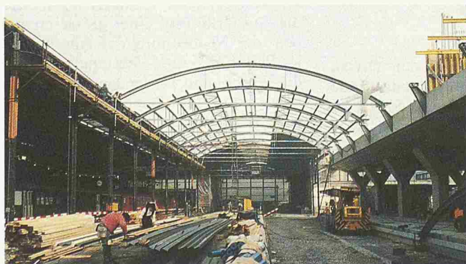
Bild 3. Schutz- und Arbeitsbühne über den Gleisen