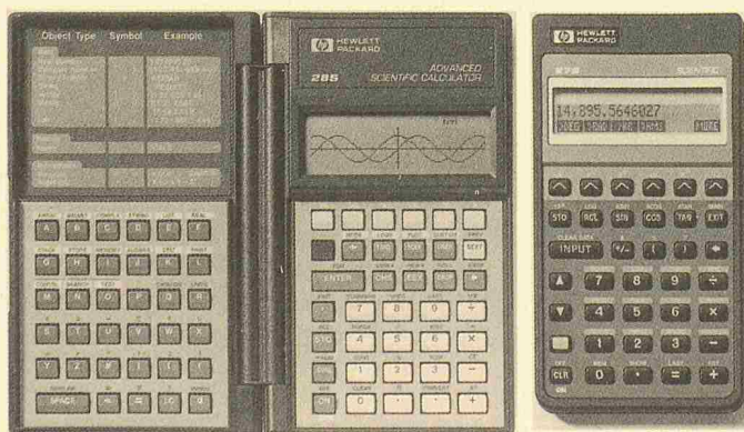
HP 28S und HP 27S

Hewlett-Packard (Schweiz) AG Schwamendingerstr. 10 8050 Zürich