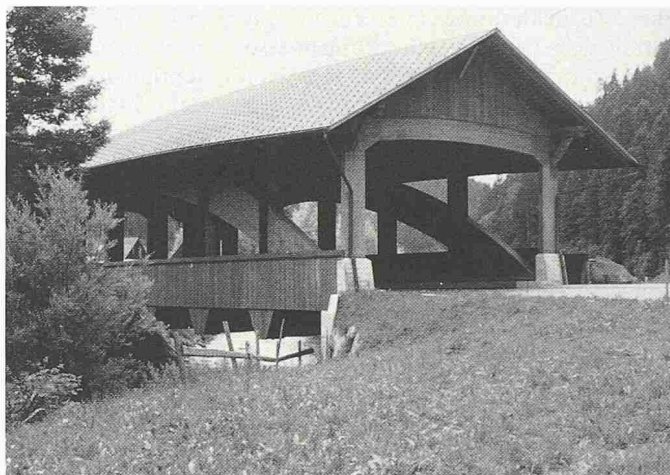
Bild 2. Strassenbrücke in Eggiwil

bringen. Hochbeanspruchte Enddiagonalen von Fachwerken beispielsweise müssen folglich nicht mehr in über-grossen Querschnitten oder sogar in Stahl ausgeführt werden, sondern lassen sich schlanker und konstruktiv einfacher in Brettschichtholz aus Buche ausbilden.