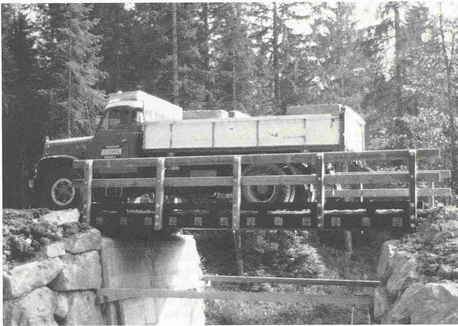
Bild 3. Brücke für Walderschliessungsstrassen

wicht der Untersuchungen an der ETH Zürich darin, das Verhalten einiger bereits ausgeführter Brücken zu beobachten.