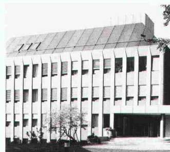
Elektrowatt-Haus 2, Zürich

Bei grossen Geschäftshäusern mit drei bis vier Untergeschossen, die oft im Grundwasser stehen, ist ein fortschrittlicher Bautenschutz, wie ihn die Renesco-Spezialisten leisten können, unentbehrlich geworden. Drei aktuelle Beispiele: