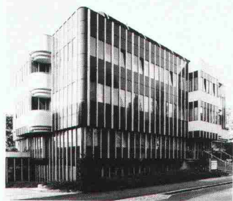
Neubau IBM, Zürich