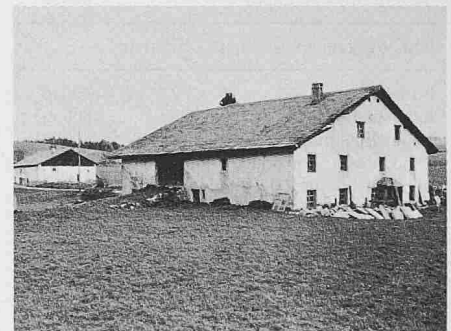
Anciennes fermes à Muriaux (Franches-Montagnes)

Im 2. Teil kommen vorwiegend Architekten zu Worte. Dienstleistung und Subventionspraxis sind die wichtigsten Mittel der eidgenössischen Denkmalpflege. Experten und Fachleute für Spezialfragen stellt der Bund den Kantonen zur Verfügung und zwingt sie ihnen bei unter eidgenössischem Schutz stehenden Bauten auch auf, was gelegentlich zu Meinungsverschiedenheiten führt. Die eidgenössische Denkmalpflege befasst sich aber nicht nur mit erstrangigen Bauten. Die bundeseigenen Bauten liegen auch in ihrer Obhut. Den wichtigsten Anteil haben hier die 800 Aufnahmegebäude der SBB, 600 davon stammen aus dem letzten Jahrhundert, und viele davon sind schüt-