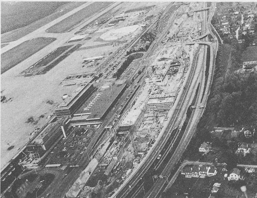
Luftaufnahme der Bahnhof-Baustelle am Genfer Flughafen Cointrin

rectement vers Lausanne par une boucle rejoignant en amont de Genève la ligne des rives du Léman. Une telle boucle a également été évoquée lors de discussions sur les transports publics régionaux. Il faut à ce sujet constater que Genève-Cointrin est une tête de ligne. Les trains n'en repartent pas immédiatement vers le nord ou l'est de la Suisse: ils subissent nettoyyages et contrôles usuels avant que les voyageurs s'y installent à nouveau. D'autre part, l'inversion systématique des trains serait difficilement compatible avec les critères bien précis auxquels répond la composition des convois.