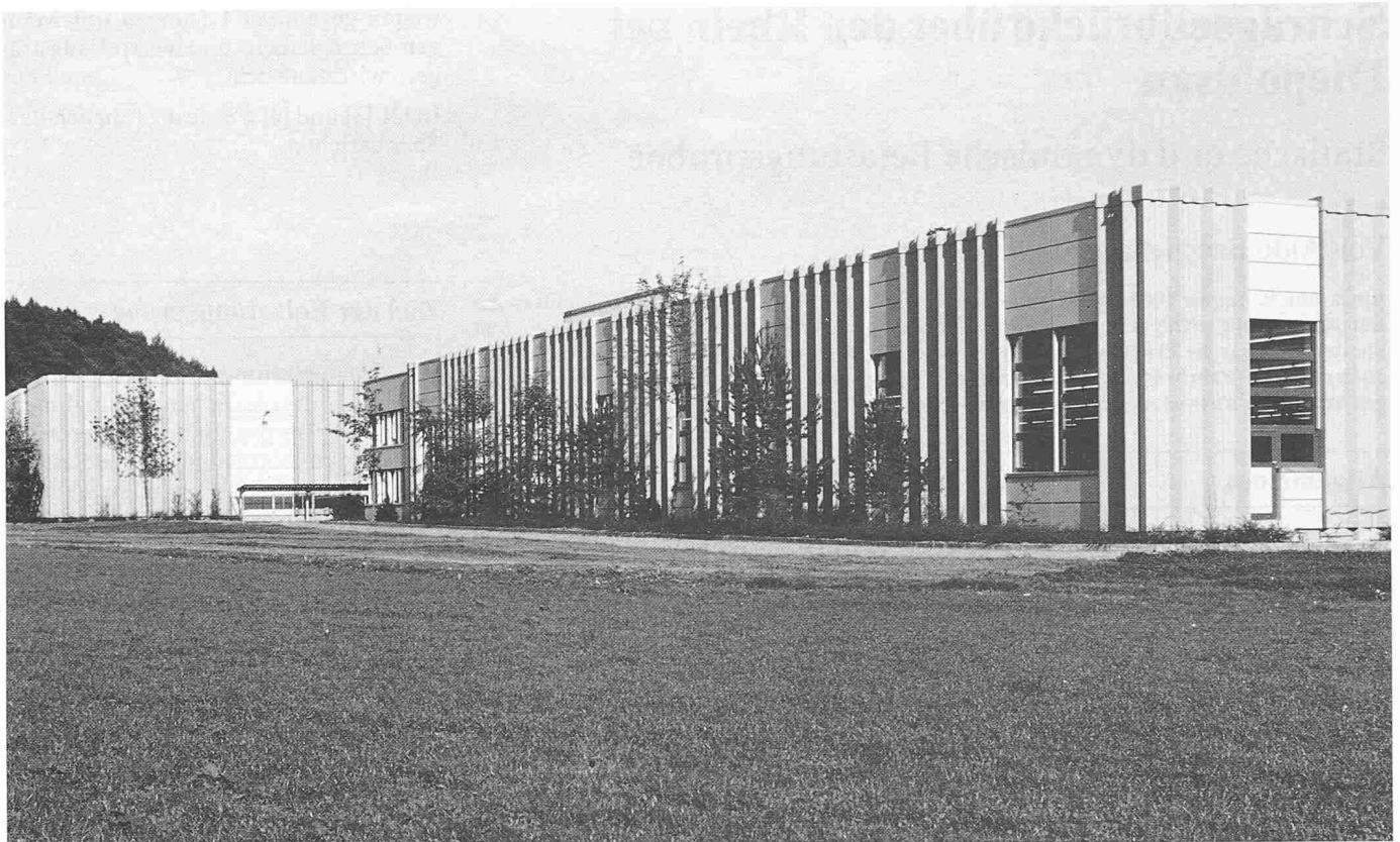
Bild 2. Die Neubauten: rechts das Spinnereigebäude, links im Hintergrund das Baumwollager

materialien (Stahl, Ortbeton oder vorgefabrizierte Betonelemente) und mögliche Stützweiten (quer und längs) ermittelt.