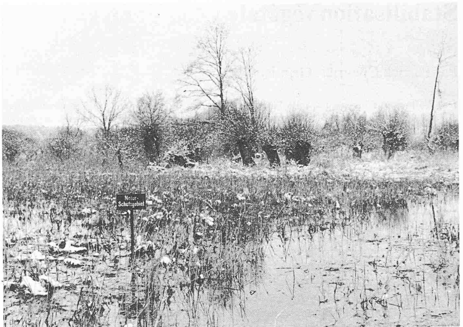
Kopfweidenhain an der Alten Ziel bei Meienried (BE)