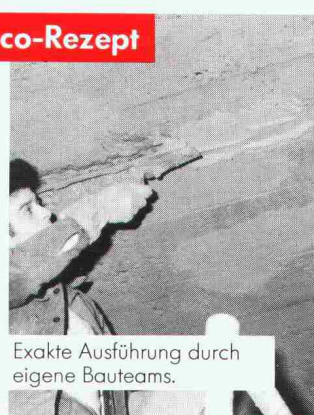
Exakte Ausführung durch eigene Bauteams.