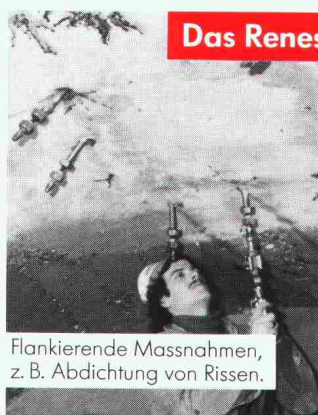
Flankierende Massnahmen, z. B. Abdichtung von Rissen.