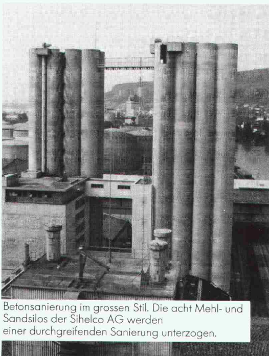
Betonsanierung im grossen Stil. Die acht Mehl- und Sandsilos der Sihelco AG werden einer durchgreifenden Sanierung unterzogen.