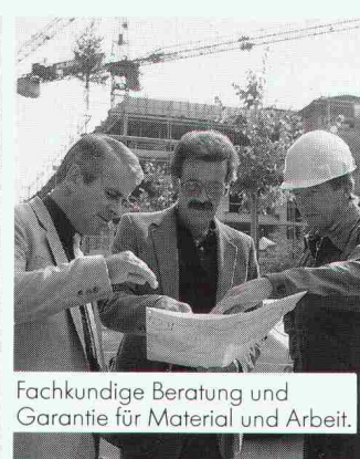
Fachkundige Beratung und Garantie für Material und Arbeit.