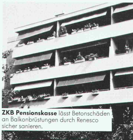
ZKB Pensionskasse lässt Betonschäden an Balkonbrüstungen durch Renesco sicher sanieren.