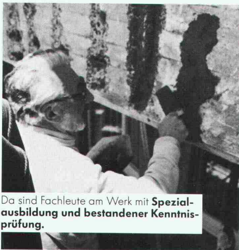
Da sind Fachleute am Werk mit Spezialausbildung und bestandener Kenntnisprüfung.