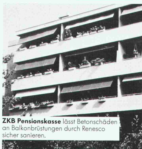
ZKB Pensionskasse lässt Betonschäden an Balkonbrüstungen durch Renesco sicher sanieren.