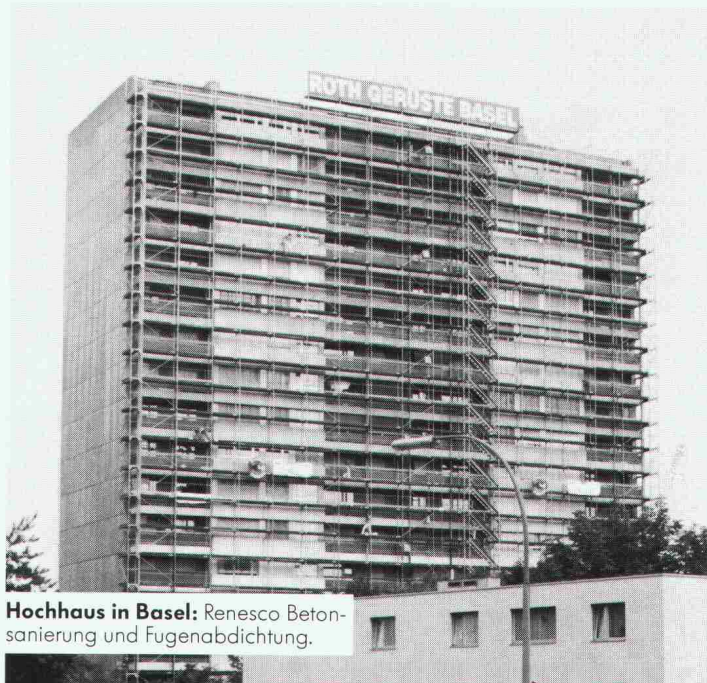
Hochhaus in Basel: Renesco Betonsanierung und Fugenabdichtung.