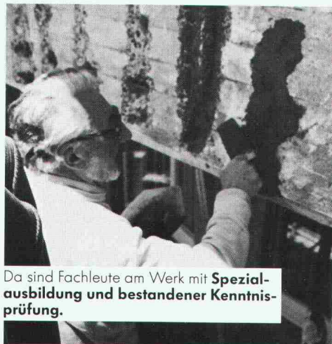
Da sind Fachleute am Werk mit Spezialausbildung und bestandener Kenntnisprüfung.