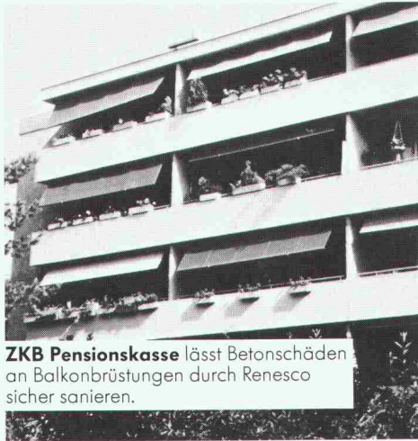
ZKB Pensionskasse lässt Betonschäden an Balkonbrüstungen durch Renesco sicher sanieren.