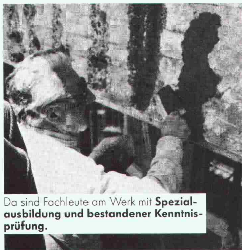
Da sind Fachleute am Werk mit Spezialausbildung und bestandener Kenntnisprüfung.