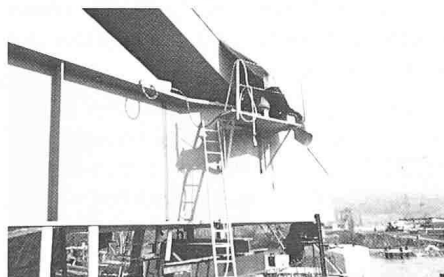
Bild 2. Montage der Aufhängungen und Querträger