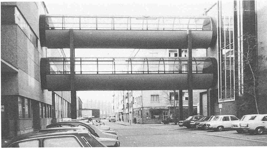
Bild 1. Die Passerelle für die Uhren- und Schmuckmesse an der Muba besteht aus zwei getrennten Röhren, die mit vier Kastenstützen rahmenartig verbunden sind