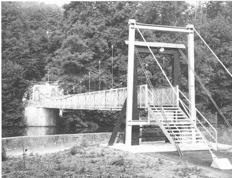
Bild 2. Sanierter Hängesteg. Die alten, erhaltenen Bauelemente sind in dunkler, die neuen in heller Farbe gehalten