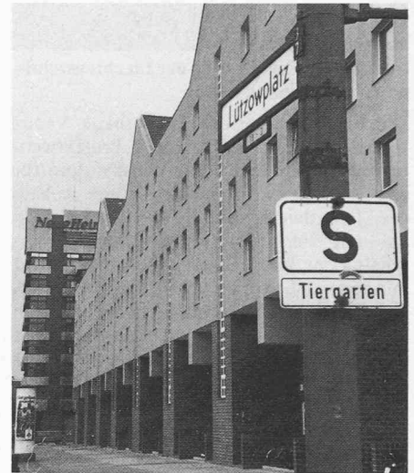
Lützowplatz West, Strassenfront

Wahrlich ein trüber Hintergrund, vor dem sich die IBA aufbaut. In gewissem merkwürdigem Kontrast ragt aus diesem Dunst der Mittelmässigkeit die Interbau 1957 im Hansaviertel, die doch wiederum Zeugnis von der latenten Kraft und dem Streben nach Offenheit über städtische, nationale und europäische Grenzen ablegte. Es waren Namen wie Eiermann, Aalto, Jacobsen, Niemeier, Gropius, die aufgerufen waren, Wege zu weisen – oder zumindest zu zeigen, was man in der Vergangenheit hätte tun können. Eine Generation später soll sich nun der Dunst wieder lichten. Nochmals wurden die Architekten der Welt eingeladen, um darüber nachzudenken, was dem Phänomen Berlin frommt, aber diesmal unter anderem Vorzeichen: die Wiederherstellung, der Reparatur stand am Anfang des Wollens, allerdings in einem sehr umfassenden Sinne. «... die konsequente, unbestechliche Einbeziehung anerkannter Architekten, Stadtplaner und Architekturkritiker des In- und Auslandes» müsste Voraussetzung sein für den Erfolg des Vorhabens ( Josef Paul Kleihues , Direktor Neubaugebiete der IBA, Berliner Morgenpost, 1977). Das liest sich heute wie Abraham, Bofinger, Eisenmann, Hejduk, Hertzberger, Holzbauer, Isozaki Krier, Richard