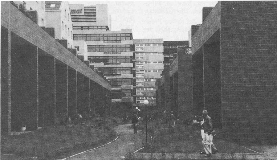
Lützowplatz West, Hofansicht, «Introvertiertes Wohnen»: O. M. Ungers

sitionen innerhalb der Bauverwaltung innehatten: Langhans war über Jahre Leiter des Oberhofbauamtes; Gilly zwischen 1788 und 1790 immerhin dort Kondukteur; Schinkel war schon 1810, also neunundzwanzigjährig, Assessor in der Baudeputation und fünf Jahre später Geheimer Oberbaurat; Wagner von 1926 bis 1933, in einer für Berlin entscheidenden Zeit, Stadtbaurat. Derlei brillante Persönlichkeiten vermochten somit revolutionäre Ideen zu gebären, auszuarbeiten und innerhalb einer umfassenden Stadtpolitik auch durchzusetzen; ihr Beitrag beschränkte sich nicht auf einzelne aufsehenerregende Bauten, sondern umfasste den städtischen Organismus als Ganzes. Später fielen solche Ideen den Leuten in den «falschen» Positionen ein, wo sie Papier blieben oder bestenfalls in zu kleinem Massstab realisiert wurden; gleichzeitig versumpfte die Stadtentwicklung im zähen bürokratischen Schlamm oder blieb im kurzatmigen Legislaturperiodendenken der Berufspolitiker stecken.