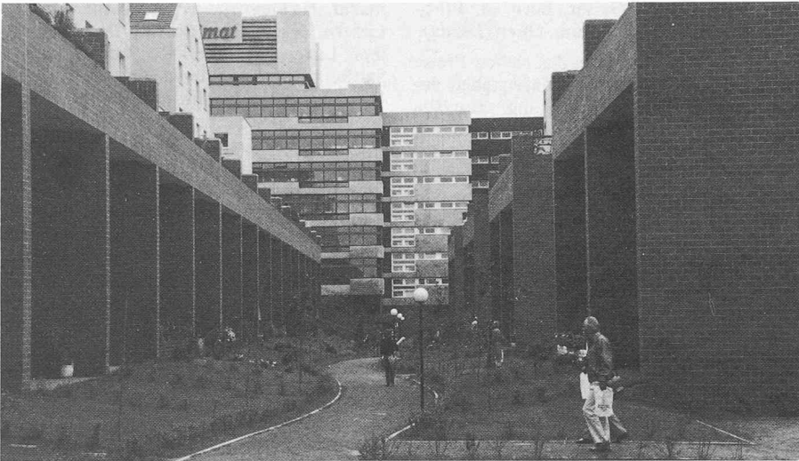
Lützowplatz West, Hofansicht, «Introvertiertes Wohnen»: O. M. Ungers

sitionen innerhalb der Bauverwaltung innehatten: Langhans war über Jahre Leiter des Oberhofbauamtes; Gilly zwischen 1788 und 1790 immerhin dort Kondukteur; Schinkel war schon 1810, also neunundzwanzigjährig, Assessor in der Baudeputation und fünf Jahre später Geheimer Oberbaurat; Wagner von 1926 bis 1933, in einer für Berlin entscheidenden Zeit, Stadtbaurat. Derlei brillante Persönlichkeiten vermochten somit revolutionäre Ideen zu gebären, auszuarbeiten und innerhalb einer umfassenden Stadtpolitik auch durchzusetzen; ihr Beitrag beschränkte sich nicht auf einzelne aufsehenerregende Bauten, sondern umfasste den städtischen Organismus als Ganzes. Später fielen solche Ideen den Leuten in den «falschen» Positionen ein, wo sie Papier blieben oder bestenfalls in zu kleinem Massstab realisiert wurden; gleichzeitig versumpfte die Stadtentwicklung im zähen bürokratischen Schlamm oder blieb im kurzatmigen Legislaturperiodendenken der Berufspolitiker stecken.