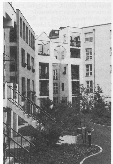
Wohnüberbauung Ritterstrasse, Innenhof: Rob Krier