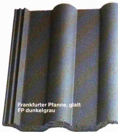
Frankfurter Pfanne, glatt FP dunkelgrau