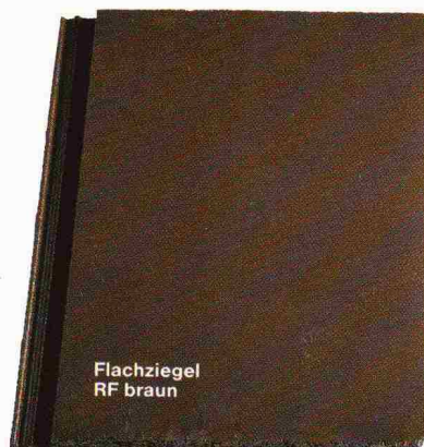
Flachziegel RF braun