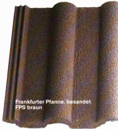
Frankfurter Pfanne, besandet FPS braun