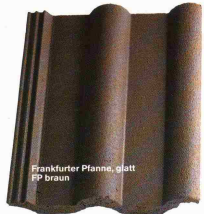
Frankfurter Pfanne, glatt FP braun