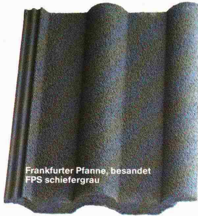
Frankfurter Pfanne, besandet FPS schiefergrau