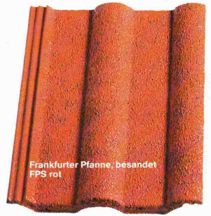
Frankfurter Pfanne, besandet FPS rot