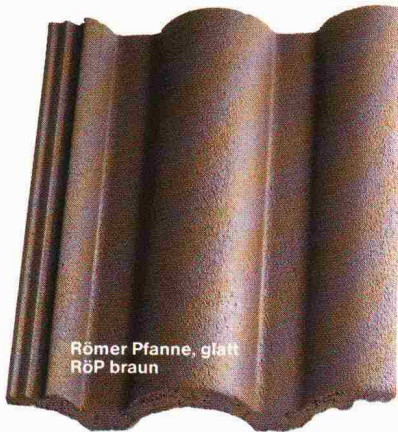
Römer Pfanne, glatt RÖP braun