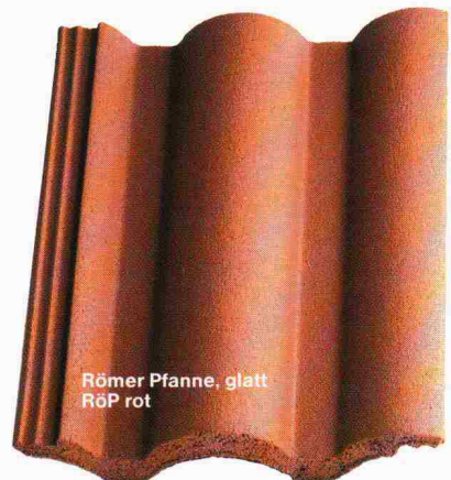
Römer Pfanne, glatt RÖP rot