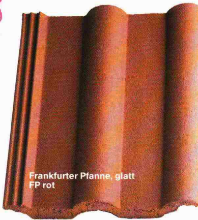
Frankfurter Pfanne, glatt FP rot