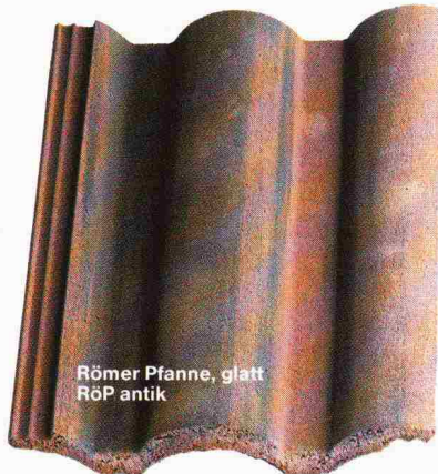
Römer Pfanne, glatt RÖP antik