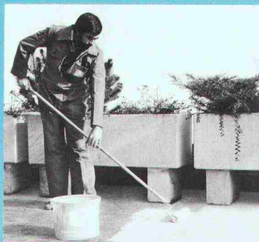
Wetter- und abriebfest