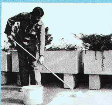
Wetter- und abriebfest