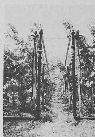
Unirac-Fittings und Kugelhahn Typ 349, installiert in einer Tropfbewässerungsanlage eines Weinberges

Erdverlegte Wasserleitungssysteme, mit Unirac-Fittings verbunden, werden auch unter schwierigen Boden- und Montageverhältnissen eingesetzt.