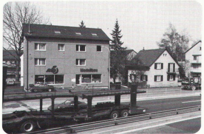
CARDOPHON®-EXTRAPHON Wohn- und Geschäftshaus an der Überlandstrasse, Zürich