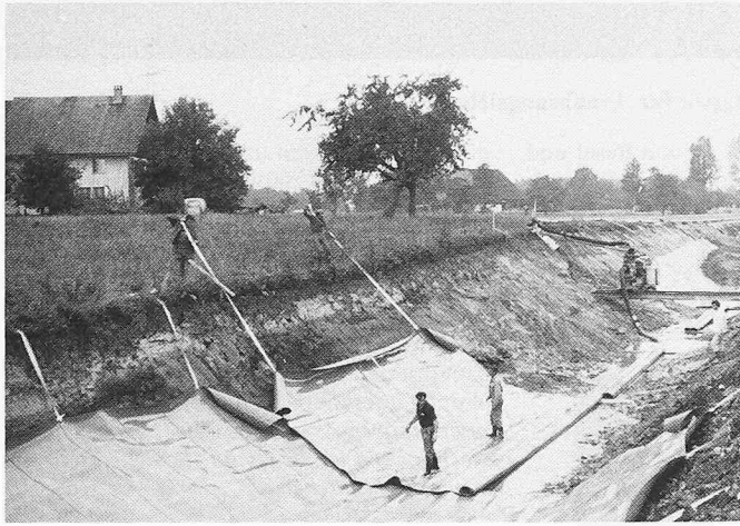
Bild 3. Aufziehen der in Kanalachse verlegten KDB mit Hilfe der eingerollten Bänder