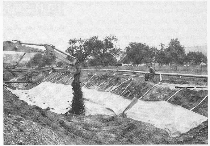
Bild 4. Aufschütten von kiesigem Material auf die verlegten und verschweissten KDB

Boden wechselte zwischen mehr oder weniger standfestem, sandhaltigem Lehm und moorhaltigen Schichten. Letztere neigten teilweise trotz nicht allzu steiler Böschung zum Absacken. Das anfallende Grundwasser wurde, soweit notwendig, abgepumpt und kanalabwärts oder in das Naturschutzgebiet geleitet (Bild 2). Die für die Dichtung notwendigen 2 mm starken KDB wurden im Werk aus acht Bahnen von 1,45 m Standardbreite zu Planen von 10,40 m Länge und 11,00 m Breite zusammengeschweisst. Anschliessend wurden sie per Lastwagen auf die Baustelle transportiert. Um das Verlegen zu erleichtern, wurden die Planen im Werk zu gegenseitig gerollten Doppelrollen gerollt, wobei eingerollte Bänder das Aufziehen auf der Böschung erleichterten (Bild 3). Die vorbereiteten KDB wurden mit dem Bagger zum Kanal transportiert und dort in der Kanalachse abgesenkt. Die neue Bahn überlappte die schon verlegte um das für das Schweißen notwendige Mass von rund 10 cm. In der Sohle wurden an den Nahtstellen der KDB vorher Bretter verlegt, um ein ungleiches Absinken der Bahnen (ungünstig für den Schweißvorgang) zu verhindern. Nach dem Aufziehen und Befestigen der Planen wurden mit dem von der Lieferfirma entwickelten Doppelheizkeilschweissauto-