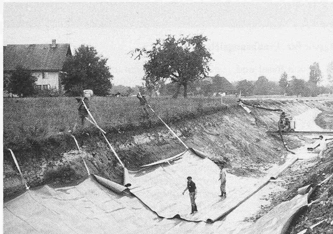
Bild 3. Aufziehen der in Kanalachse verlegten KDB mit Hilfe der eingerollten Bänder