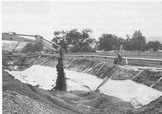
Bild 4. Aufschütten von kiesigem Material auf die verlegten und verschweissten KDB

Boden wechselte zwischen mehr oder weniger standfestem, sandhaltigem Lehm und moorhaltigen Schichten. Letztere neigten teilweise trotz nicht allzu steiler Böschung zum Absacken. Das anfallende Grundwasser wurde, soweit notwendig, abgepumpt und kanalabwärts oder in das Naturschutzgebiet geleitet (Bild 2). Die für die Dichtung notwendigen 2 mm starken KDB wurden im Werk aus acht Bahnen von 1,45 m Standardbreite zu Planen von 10,40 m Länge und 11,00 m Breite zusammenschweisst. Anschliessend wurden sie per Lastwagen auf die Baustelle transportiert. Um das Verlegen zu erleichtern, wurden die Planen im Werk zu gegenseitig gerollten Doppelrollen gerollt, wobei eingerollte Bänder das Aufziehen auf der Böschung erleichterten (Bild 3). Die vorbereiteten KDB wurden mit dem Bagger zum Kanal transportiert und dort in der Kanalachse abgesenkt. Die neue Bahn überlappte die schon verlegte um das für das Schweiessen notwendige Mass von rund 10 cm. In der Sohle wurden an den Nahtstellen der KDB vorher Bretter verlegt, um ein ungleiches Absinken der Bahnen (ungünstig für den Schweissovorgang) zu verhindern. Nach dem Aufziehen und Befestigen der Planen wurden mit dem von der Lieferfirma entwickelten Doppelheizkeilschweissauto-