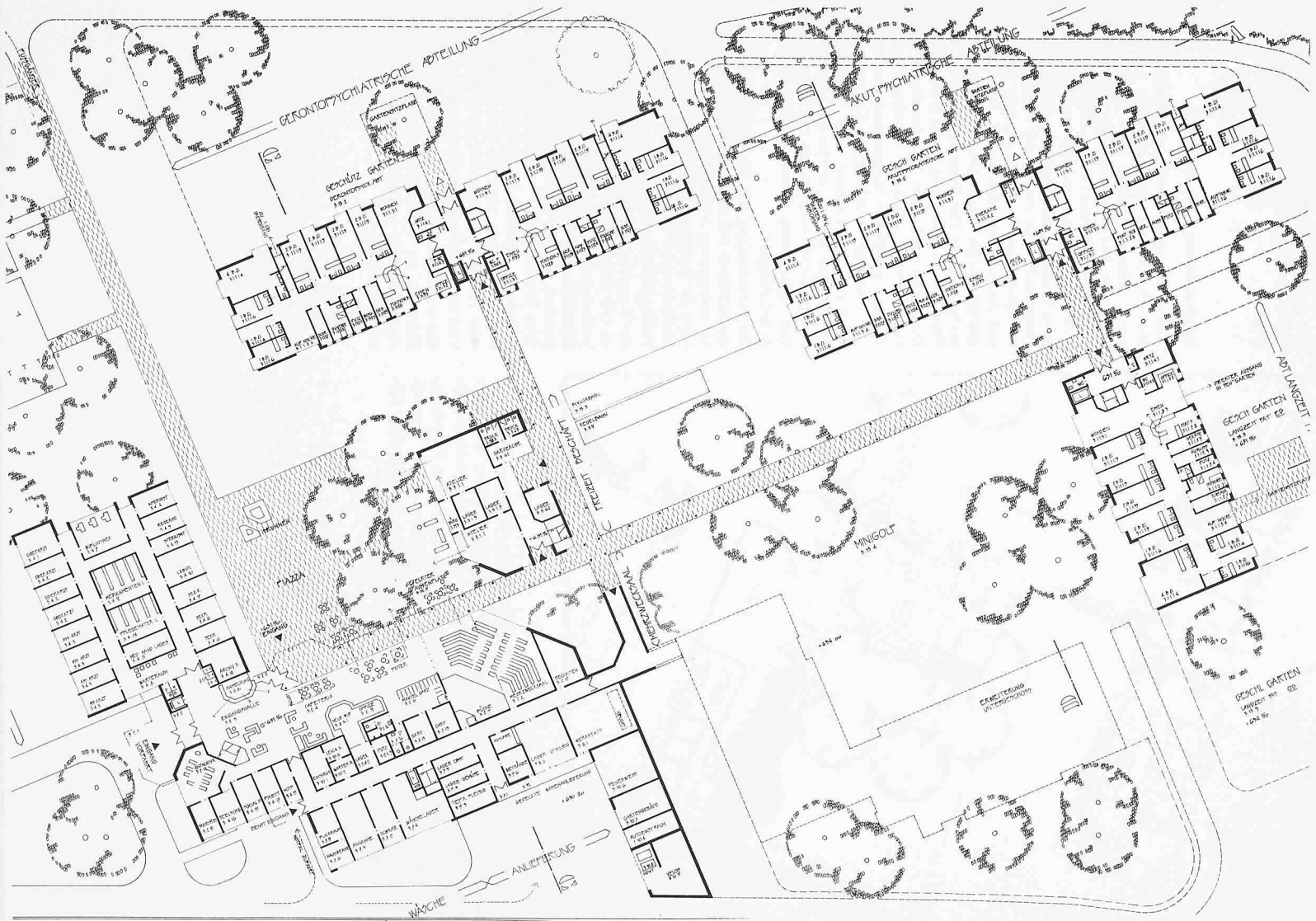
Grundriss Erdgeschoss 1:900