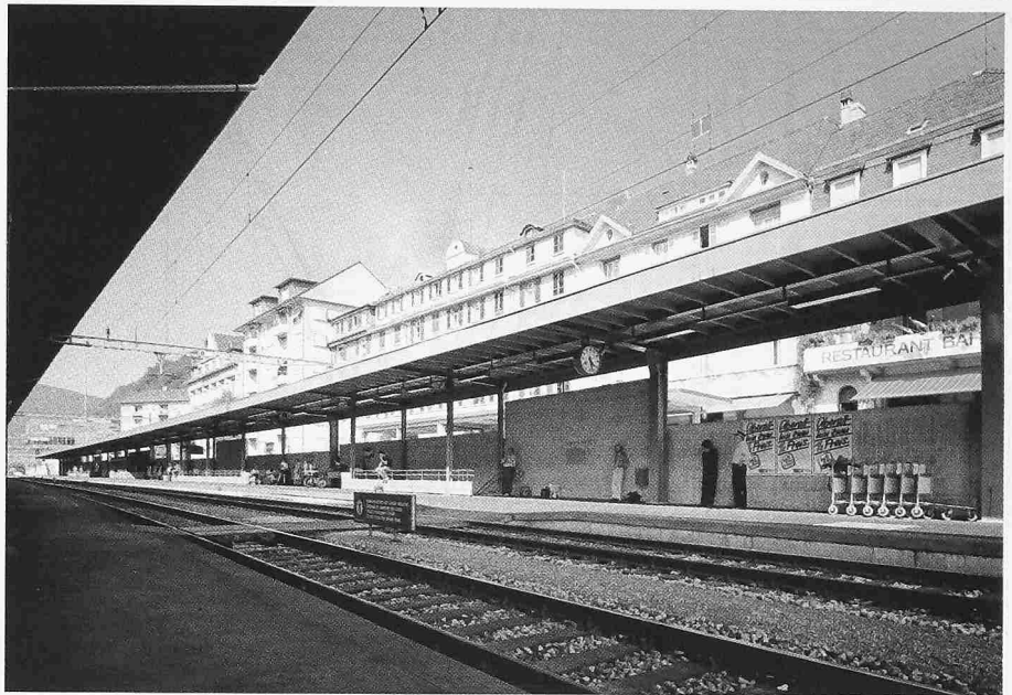
Bild 2. Der neue Aussenperron, links das neue Zentralstellwerk

Zu den bisher aufgeführten «Zweckbauten», denen zusätzlich der gesamte Gleisumbau einschliesslich Unterbausanierung sowie die Verlängerung aller alten, bestehenden Perronanlagen angehörten, gesellten sich im Bahnhofbereich noch einige «Komfortbauten», wie die Erhöhung der Perronkanten auf das Standardmass 300 mm über SiOK, der Ersatz je eines Treppenaufganges pro Perron durch eine Rampe, der Neubau der Aufzugsanlagen für die PTT sowie weitere, in den anderen Fachdienstbeiträgen näher beschriebene Bauten.