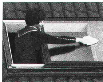
Beim Braas-Atelierfenster problemloses Reinigen auch der Fenster-Aussenseite.