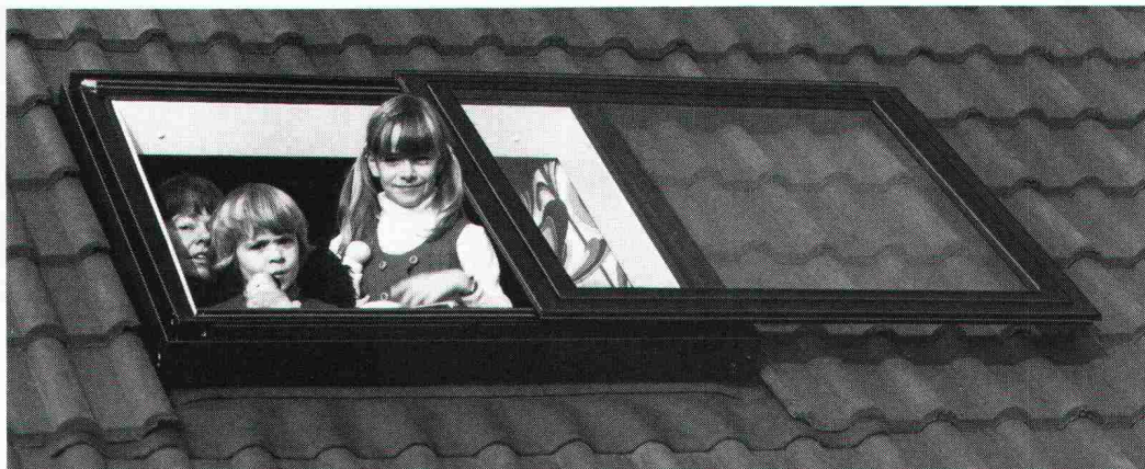
Das Braas-Atelierfenster lässt den Sonnenschein herein.

Zum behaglichen Wohnen in einem Dachraum gehört das Tageslicht, der freie Ausblick zum Himmel und in die Natur. Aber versuchen Sie einmal, die Sonne so richtig hereinzulassen, wenn sich das Dachfenster nur bis zu einer bestimmten Öffnung hochkippen lässt. Oder wenn schon, wie klappen Sie ein ganz aufs Dach hochgelegtes Fenster wieder mühe-los zurück?