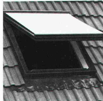
Reichhaltiges Zubehör: Rollos, Jalousetten oder Markisen.

Die eloxierten Aluminiumteile und der durchgefärbte Hart-PVC sind absolut witterungsbeständig und rostfrei. Zur Auswahl stehen 8 verschiedene Fenstergrössen und Verglasung nach Wunsch: Sonnenschutz-, Sicherheits-, Isolier- oder Thermopluglas.