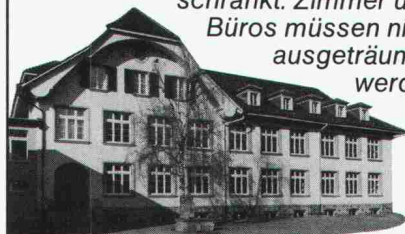
Schulhaus in Bremgarten, BE. Altbau renoviert mit Holz-Wechselrahmen-Fenstern und Isolierverglasung.

Einsatzort auf ein Minimum beschränkt. Zimmer und Büros müssen nicht ausgeträumt werden