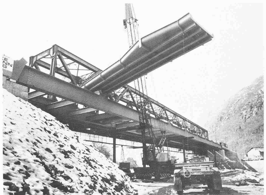
Bild 4. Montage der Stalkonstruktion

Da die Rhone im Winterhalbjahr Niederwasser führt und dabei das halbe Flussbett trocken liegt, schrieb die BLS auf Wunsch des kantonalen Wasserbauamtes vor, dass die Montage der Stahl-