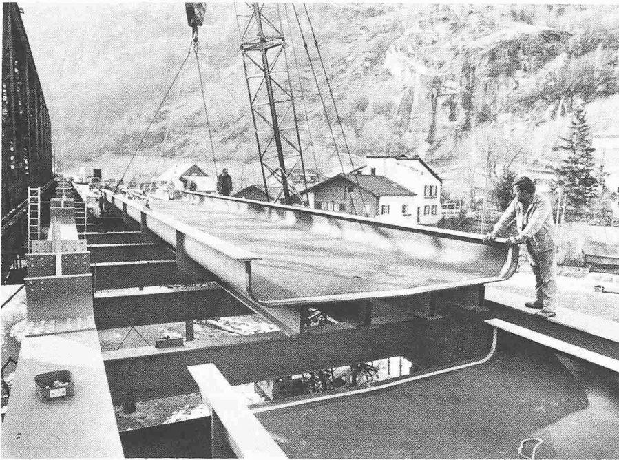
Bild 2. Schottertroge

steifungen, mit allseitiger Zugänglichkeit und Gewähr für besten Korrosionsschutz.