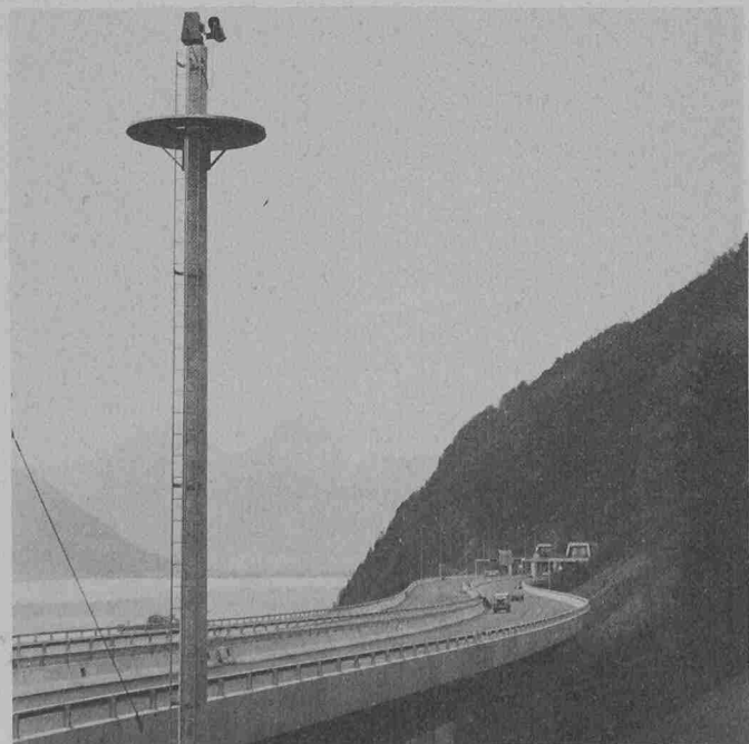
Vollbewegliche Mastenkamera. Sie steht nördlich des Tunnels und überblickt einen grossen Teil des Lehnenviaduktes

An die Robustheit der Kameras sind hohe Anforderungen gestellt. Sie müssen resistent sein gegen Abgase von Verbrennungsmotoren, gegen Schwefel, alkalische Wasser, Streusalz und Strassenstaub, gegen Waschmittel bei der Tunnelreinigung und gegen Temperatur- und Feuchtigkeitsunterschiede. Die Kameras sind zudem gegen elektrische und magnetische Felder abgeschirmt. Kameraanschluss und Kamerabefestigung sind so ausgelegt, dass eine schnelle Demontage und Montage im Wartungsfall gewährleistet ist.