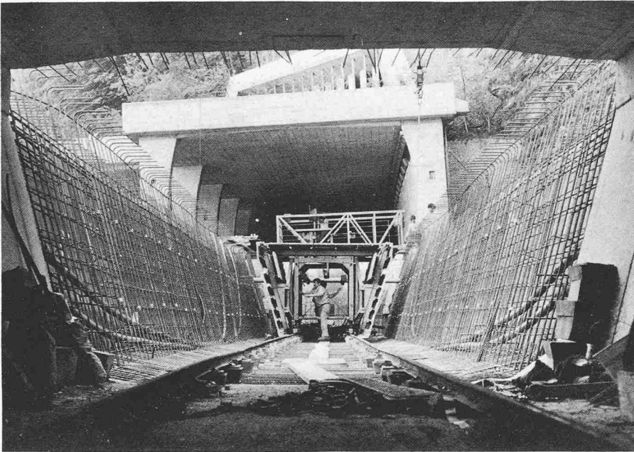
Lehnenviadukt Beckenried. Stand der Bauarbeiten: Mitte Mai 80. Schalen und armieren des letzten Brückenfeldes vor dem Nordportal des Seelisbergtunnels