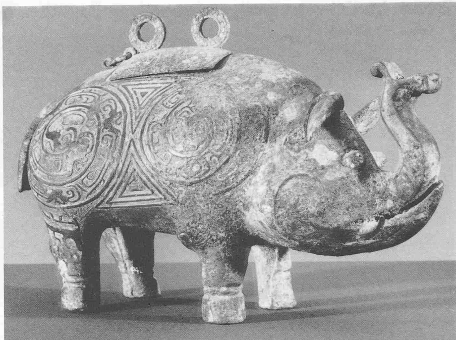
Zun in Gestalt eines Elefanten, westliche Zhou-Dynastie, 10. Jahrhundert v. Chr., Bronze