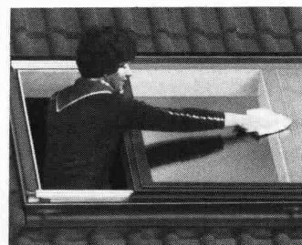
Beim Braas-Atelierfenster problemloses Reinigen auch der Fenster-Aussenseite.