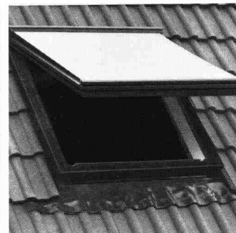
Reichhaltiges Zubehör: Rollos, Jalousetten oder Markisen.

Die eloxierten Aluminiumteile und der durchgefärbte Hart-PVC sind absolut witterungs-beständig und rostfrei. Zur Auswahl stehen 8 verschiedene Fenstergrößen und Verglasung nach Wunsch: Sonnenschutz-, Sicherheits-, Isolier- oder Thermopluglas.