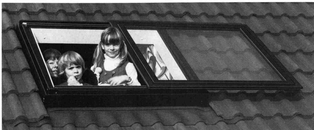
Das Braas-Atelierfenster lässt den Sonnenschein herein.

Zum behaglichen Wohnen in einem Dachraum gehört das Tageslicht, der freie Ausblick zum Himmel und in die Natur. Aber versuchen Sie einmal, die Sonne so richtig hereinzulassen, wenn sich das Dachfenster nur bis zu einer bestimmten Öffnung hochkippen lässt. Oder wenn schon, wie klappen Sie ein ganz aufs Dach hochgelegtes Fenster wieder mühe-los zurück?