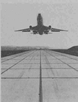
Herbag-Belags- und Pistenplatten

Überall wo es gilt, in kurzer Zeit hochbelastbare Strassen, Pisten, Plätze zu bauen, da sind Herbag-Platten die ideale Lösung: Für Baustellenzufahrten, Umfahrungen, Parkplätze, Trottoirs, Werkhöfe, Böden in Werk- und Lagerhallen, Kanalabdek-